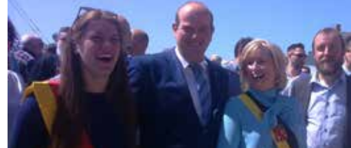
Feestelijke opening van de Leiebrug op 25 mei