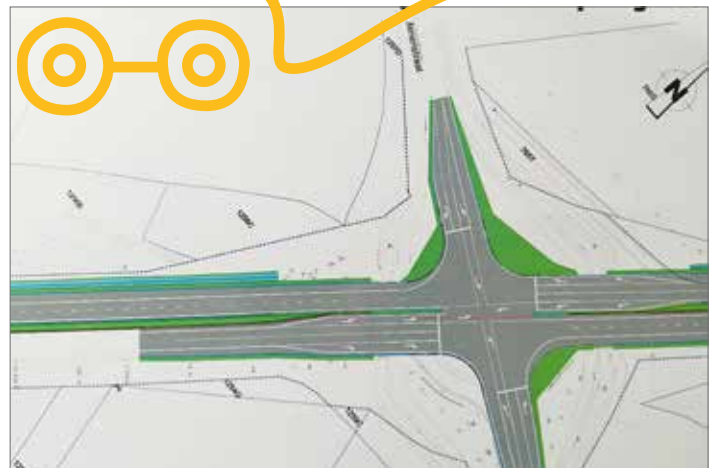
▲ De rotonde tussen de N58 en N8 verdwijnt en wordt een kruispunt met verkeerslichten en twee keer twee rijstroken op N58. De fietstunnels blijven.