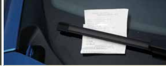
Opgelet op de Vrijdagmarkt! (p.3)