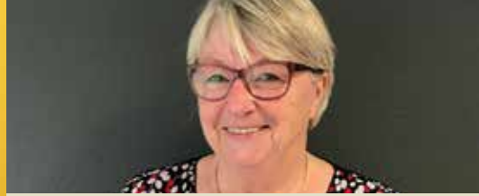
Een lid in de kijker (p.2)